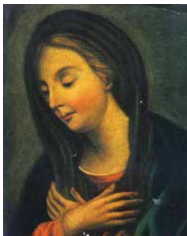
re particolare, perché all'Assunta è dedicata la Cattedrale.

Festa dell'Assunta. Nel giorno di Ferragosto ricorre la festa dell'Assunzione di Maria in cielo che è una tradizione di fede, già a partire dal V secolo e si è sviluppata nel corso del tempo, fino a raggiungere nel Medioevo, sia il riconoscimento dell'autorità ecclesiastica che un profondo radicamento nella devozione popolare. Il dogma dell'Assunzione è stato proclamato da Papa Pio XII, nell'anno giubilare del 1950 con la Costituzione apostolica "Magnificientissimus Deus". L'Assunzione di Maria è anticipazione della risurrezione della carne che per tutti gli uomini avverrà soltanto alla fine dei tempi, con il Giudizio universale. In Urbino questa solennità acquista un valo-